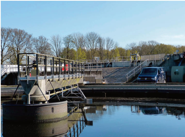
Toepassingen voor KA20

Reparatie in het riool bij gebreken aan beton, metselwerk en voegen. Rioolput sanering, overlaging van gootbodems, reprofilering en afschotlagen, installatie van opvoervijzels met KA20 rioolwatermortel R4