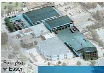
Fabryka w Essen

awdzony i uznany jako symbol światowej jakości. Ogromna i zróżnicowana paleta produktów, stała, wysoka jakość produkcji również specjalistyczne doradztwo techniczne, wypracowało nasze