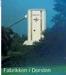
Fabrikken i Dorsten