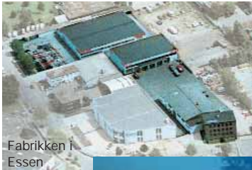
Fabrikken i Essen

I over 35 år har PAGEL SPEZIAL-BETON GmbH & Co. KG i Essen, hatt en ledende rolle i utviklingen av støpe- og spesialmørtler. PAGEL er blitt ensbetydende med anerkjent kvalitet over hele verden. PSB PAGEL er Tysklands største produsent av ekspanderende støpemørtler, samt blant de ledende produsenter av sementbaserte betong-renovasjons-systemer (PCC), under sertifikat-ordningen ZTV-ING 90. I nært samarbeid med andre spesialister utvikler og produserer PSB PAGEL desuten produkter til overflatebeskyttelse av betong og mur, industrigulv samt kunststoffbelegg.