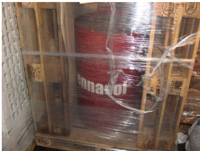
Formschluss durch zusätzliche Euro Paletten. So müssen einzelne Fässer verladen werden.