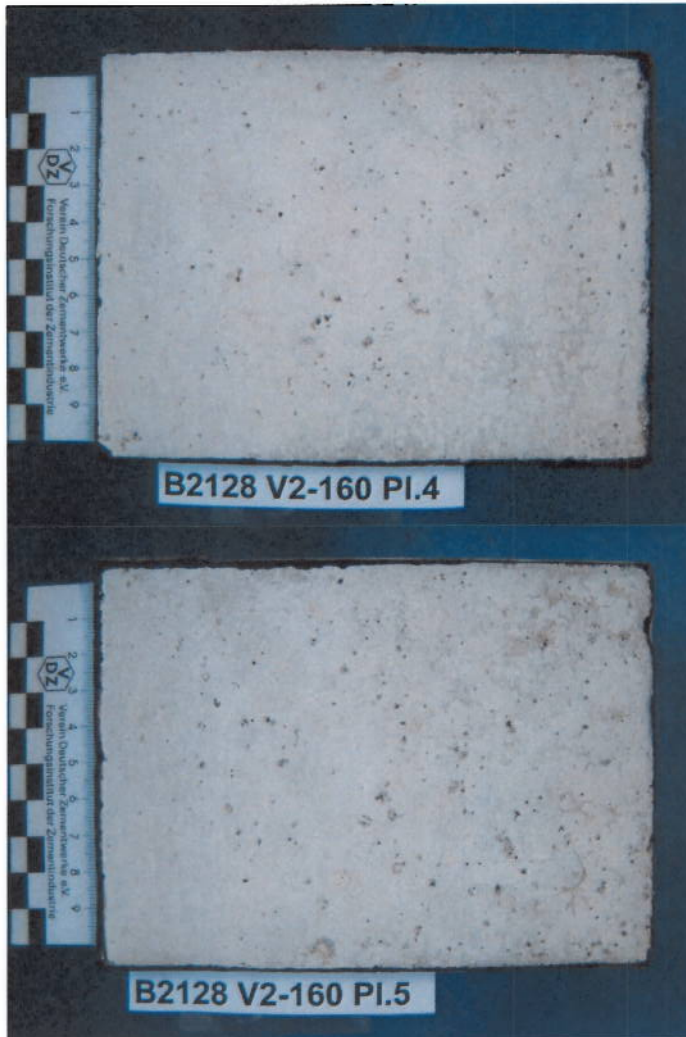
Bild 4 Probekörper V 2/160 - 4 nach 28 Frost-Tau- Wechseln